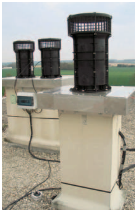
LE PROCÉDÉ UTILISE LES CONDUITS EXISTANTS DE LA VENTILATION NATURELLE. D'où la nécessité de vérifier, en premier lieu, leur tirage afin que l'extraction naturelle puisse prendre le relais de l'extracteur mécanique s'il s'avérait déficient.

Chaque composant possède un rôle bien défini. En modulant le débit d'air en fonction du taux d'humidité relative, les entrées d'air hygroréglables répartissent le débit d'air neuf admis selon les différents besoins des pièces principales du logement. L'air vicié est ensuite extrait depuis les pièces techniques par les grilles d'extraction hygroréglables modulant le débit en fonction des besoins. En cuisine, l'air est extrait depuis les appareils à gaz. Auparavant, la ventilation et l'évacuation des